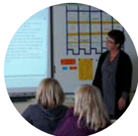
Digital skrivtavla skapar nya möjligheter