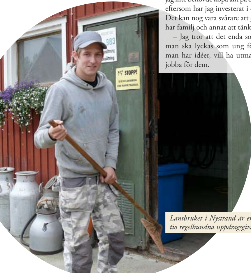
Lantbruket i Nystrand är en av Pärs cirka tio regelbundna uppdragsgivare.

Ungdomar som vill att verksamheten ska fortsätta kan höra av sig till Stig på telefon 070-422 43 65 eller Hampus 070-292 79 74 för att vara med och bilda en förening.