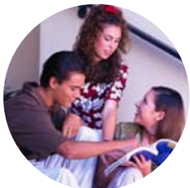
Kommunen satsar på ungdomsfrågor