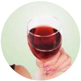
Munskänkarna lär sig mer om vin