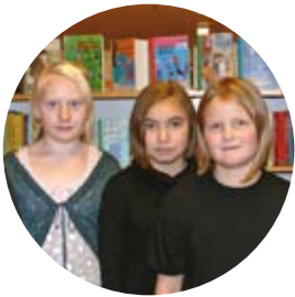
Sex tjejer tycker till om Älvsbyn