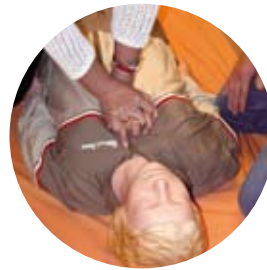
Förening som vill rädda liv