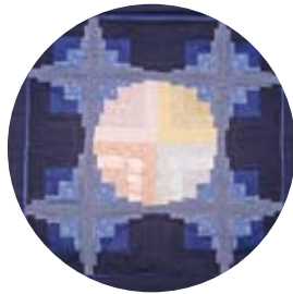
Växande intresse för lapptäcksteknik