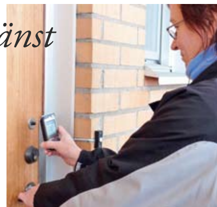
Hemtjänsten låser upp dörren hos omsorgstagarna med mobiltelefonen.

I vårdtagarens bostad byts låsvredet på insidan av ytterdörren till ett något större vred som sitter på en platta. I den plattan finns en liten dator. När personalen kommer knackar de på dörren, i närheten av låskolven på utsidan. Det aktiverar datorn som då skickar signaler till den programvara som är installerad i mobiltelefonen som personalen har med sig. Telefonen uppfattar signalerna under förutsättning att personalen har loggat in i systemet med sitt användarnamn och lösenord.