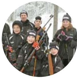
Längdåkare med siktet inställt