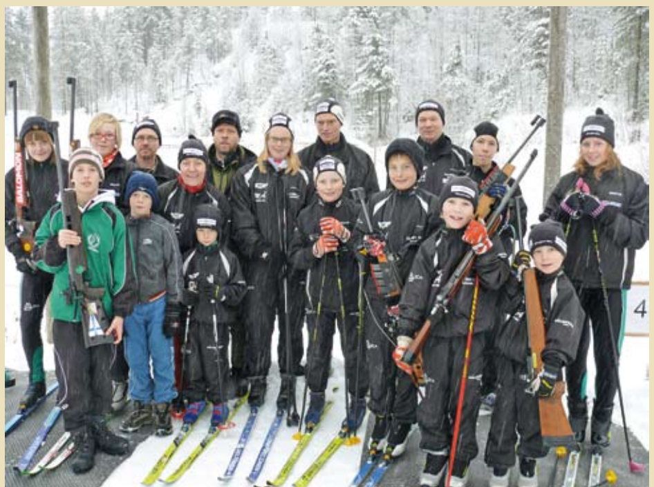
Skidskytteungdomar och ledare.

Kontakta Älvsbyns kommun, tfn 0929-170 00, eller e-post: redaktor@aelvsbyn.se