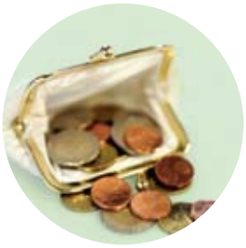
Investeringar för 16 miljoner