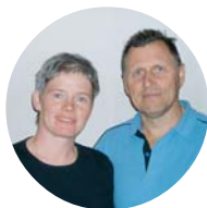
Vidsele tar sikte på framtiden