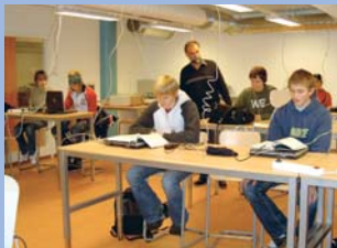
I gymnasiets källare har nya ändamålsenliga undervisningslokaler för teknik inretts. Här är det TE2 som har lektion.