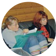
Äventyrlig förening med fantasi