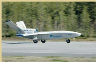
Italienska Alenia testar en UAV (obemannad flygande farkost) på RFN i höst.