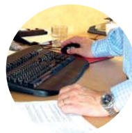
Kent sparar tid och pengar